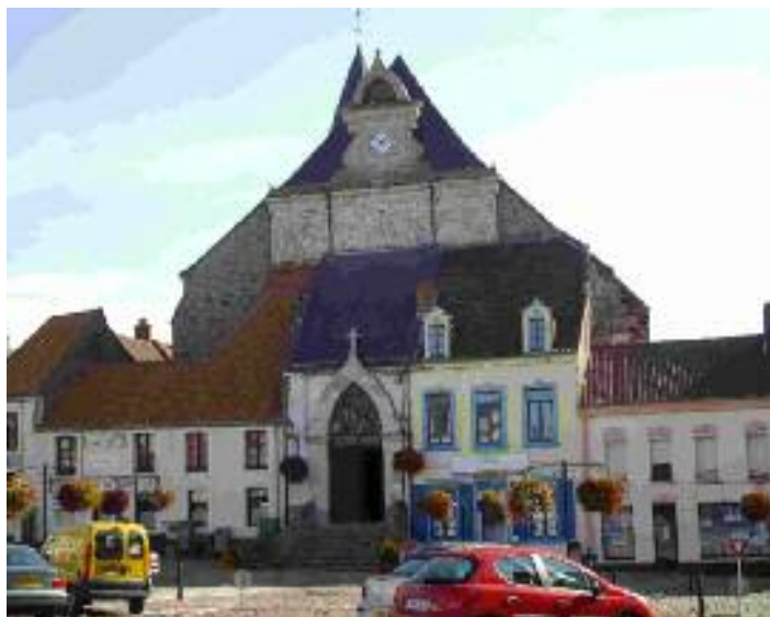
Eglise de Samer

Ces GENEAU ont eu de nombreux descendants à Samer, puis à Boulogne à partir du 19 ème siècle. On y trouve de nombreux artisans, boulangers, cordonniers, bouchers, marins ou manoeuvriers.