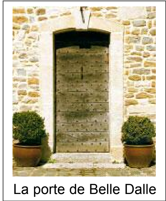
La porte de Belle Dalle

prêt à être utilisé et nous venons de clore la moisson 2009.